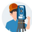
MISE EN STATION