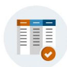
BIBLIOTHEQUE ET CODIFICATION