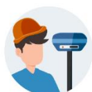
LEVÉ DE TERRAIN