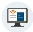
INSTALLATION ET LICENCES

Les fiches pratiques vous permettent de retrouver des « pas à pas » utiles et répartis par grands thèmes :