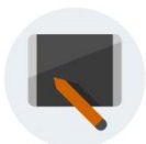
CONFIGURATION DE LA TABLETTE