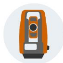
APPAREILS DE MESURE